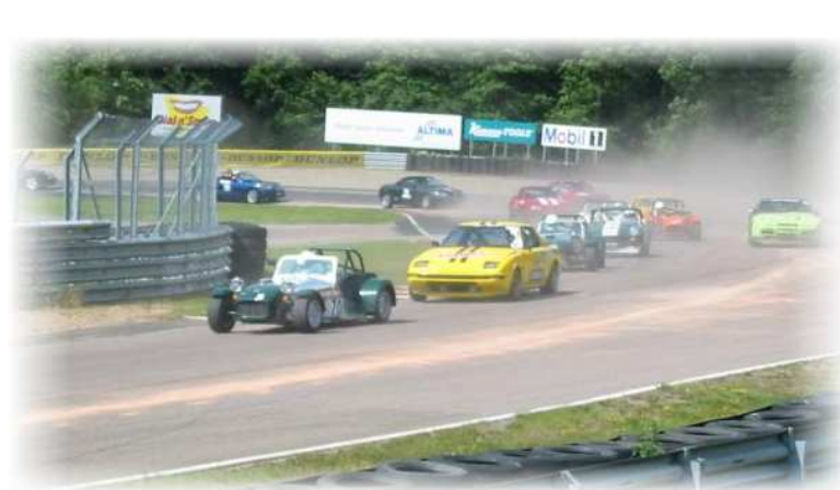
Och förstås... Sportvagnsracing på Ring Knutstorp