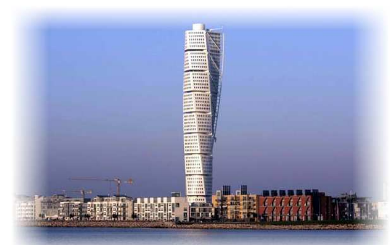
Spendera några dagar i Malmö