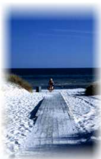
Skåne har massor av fantastiska badstränder