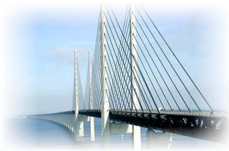
På andra sidan sundet finns mycket att göra